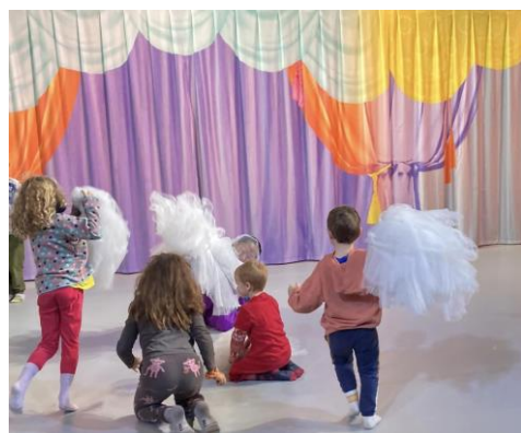
"För att jag säger det" på Unga Klara

Under året har vi även fått besöka Unga Klara Stadsteater som erbjöd oss fribiljetter till föreställningarna "För att jag säger det" och "TUMA" vid fler tillfällen.