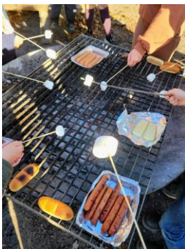
Grill i Kaknäs Äventyrsпарк

Föreningens verksamhet består av nätverksträffar, utflykter, fristående aktiviteter och återkommande traditioner, bland annat i samband med lov och storhelger. Pandemibegränsningarna påverkade uppstarten av verksamhetsåret och under våren planerade vi med kort framförhållning sedan fick vi möjlighet att börja planera och genomföra fler olika aktiviteter när restriktionerna släpptes. På alla våra träffar bjuder vi deltagare på fika eller lunch.