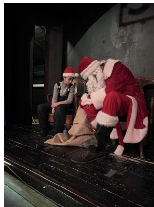
Julafton på Skansen