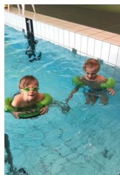
Påskbad i Åkeshov