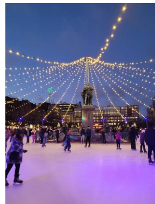
Skridskor i Kungsträdgården