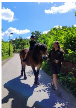
Ridning på Eolshälls 4-H

2/1 Grillträff i Hellasgården 29/1 Lekträff med grillning i Kaknässparken 19/3 Vandring i Ursvik 18/4 Äggjakt i Kaknässparken 7/5 Bebisträff i Kronobergsparken 22/5 Bebisträff på Djurgården 11/6 Skatetränäff 4/6 Bebisträff på Björklunds Hage 4H-gård 5/6 Volleybollträff på Gärdet 6/6 Nationaldagspicknick 12/6 och 18/6 4H-träffar på Eolshälls med ridning och grill 24/6 Midsommar i Spånga 3/7 Sommarpicknick i Rålambshovsparken 9/7 Cykelskola i Flemingsberg 17/7 Minigolf i Tanto 30/7 och 27/8 Grill i Rinkeby 29/10 Grill i Kaknässparken med Halloweentema 12/11 Grillträff i Kista 24/12 Julafton på Skansen 27/12 Skridskor i Kungsträdgården 31/12 Nyårsgrill i Kaknässparken