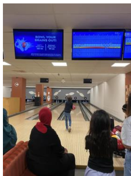
Bowling på höstlovet