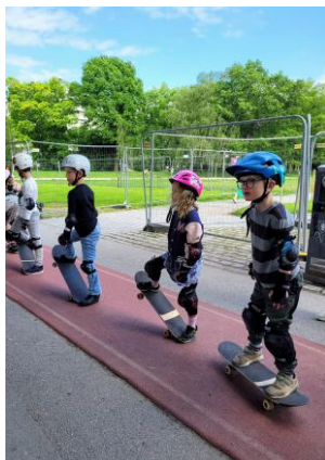
Skateskola i Rålis