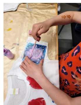
Medlemsfest med textiltryck